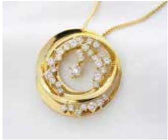
K18ダイヤモンドネックレス (1.50ct) ⓧ1,100,000円を 348,000円 (税込)