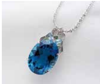
Ptブルートパーズネックレス (11.35ct, D:0.03ct) ⓧ550,000円を 158,000円 (税込)