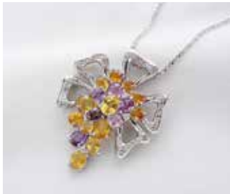
Ptファンシーサファイヤネックレス (7.45ct, D:0.43ct) ⓧ1,870,000円を 298,000円 (税込)