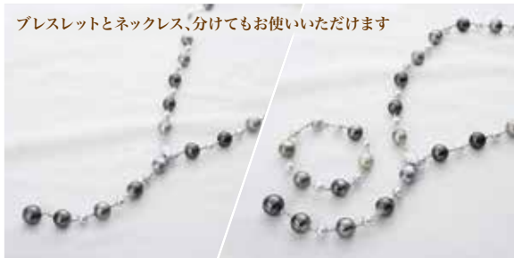
アカoyaパールネックレス(10.0~10.8mm) ⓧ1,430,000円を 298,000円 (税込)