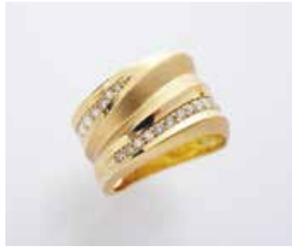
K18ダイヤモンドリング (0.41ct) ⓧ715,000円を 238,000円 (税込)