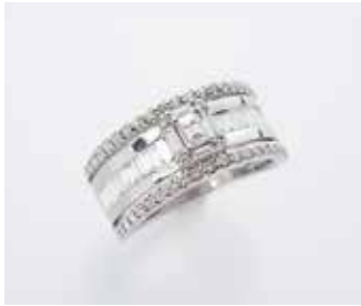
Ptダイヤモンドリング (1.00ct) ⓧ715,000円を 218,000円 (税込)